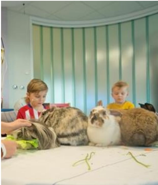
Soms komen vrijwilligers langs je bed met dieren van de kinderboerderij

In het ziekenhuis zijn een heleboel vrijwilligers. Dat zijn mensen die soms in het ziekenhuis werken, maar er geen geld voor krijgen. Ze doen het omdat ze het leuk vinden om iets voor de patiënten te doen. Ze zijn onmisbaar!