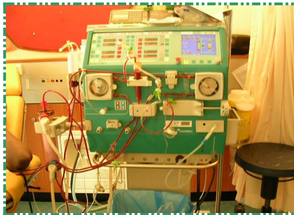
Ingewikkeld apparaat he, een dialyse machine!

Bij de nierdialyse staan vier grote stoelen. Hier ga je op liggen en door een infuus in je arm loopt het bloed uit je lichaam de machine in. De machine neemt de taak van je nieren over en maakt je bloed weer schoon. Dat heet spoelen en duurt ongeveer drie uur. Je bloed is dan maar voor even schoon. Sommige kinderen moeten wel drie keer in de week naar de nierdialyse.